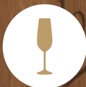
TIPO DE COPA